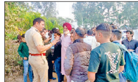
यमुनानगर। अर्ध जली हालात में मिले व्यक्ति के शव की मौत के मामले में कार्रवाई करती पुलिस।