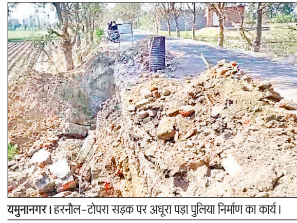
यमुनानगर। हरनौल-टोपरा सड़क पर अधूरा पड़ा पुलिया निर्माण का कार्य।