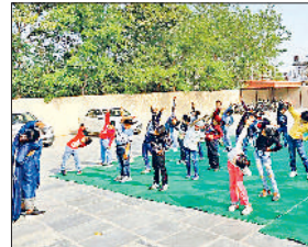
अंबाला। व्यक्तित्व विकास शिविर में हिस्सेदारी करते छात्र।