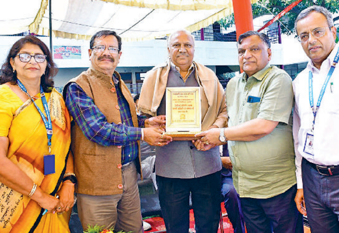
पानीपत। एसडी कॉलेज में अतिथि को स्मृति चिह्न भेंट करते हुए मेजबान।