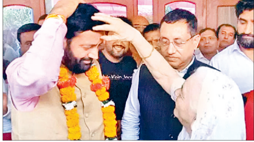
अंबाला। सीएम नायब सैनी के माथे पर तिलक लगाती मां।

मनोहर लाल ने बड़ी कुर्बानी दी, एक पिता भी बेटे के लिए ऐसा नहीं कर सकता