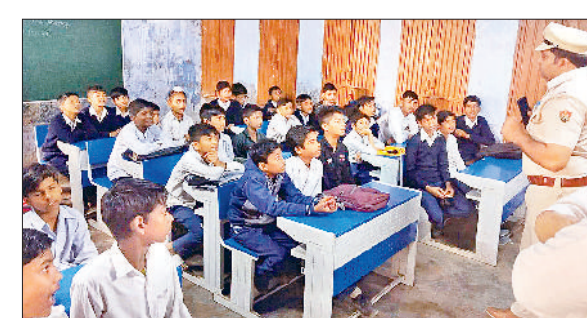
अंबाला। नशे के खिलाफ छात्रों को जागरूक करते पुलिस अधिकारी।