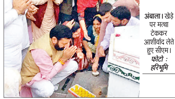
अंबाला। खेड़ों पर मत्था टेककर आशीर्वाद लेते हुए सीएम।