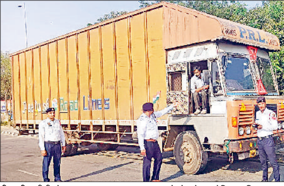
पानीपत। जीटी रोड पर लापरवाह वाहन चालकों को रोकते हुए ट्रेफिक पुलिस।

पानीपत यातायात पुलिस द्वारा राष्ट्रीय राजमार्ग पर सड़क सुरक्षा सुनिश्चित करने के लिए वीरवार को विशेष चेकिंग अभियान चलाया गया। अभियान के तहत लेन के नियमों का उल्लंघन करने वाले 192 भारी वाहनों के चालान किये। विशेष अभियान के तहत जिला यातायात पुलिस ने जिले में दिल्ली से चंडीगढ़ नेशनल हाइवे पर बाबरपुर ट्रेफिक थाना व पेप्सी पुल के पास एक साथ चेकिंग की। बाबरपुर ट्रेफिक थाना प्रभारी